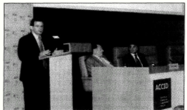
El Congrés d'aquest any ha superat l'assistència del 2005.

El Segon Congrés Català de Comptabilitat i Direcció es va celebrar, els dies 24 i 25 de maig, a l'IESE Business School. El Congrés, organitzat per l'Associació Catalana de Comptabilitat i Direcció (ACCID) va comptar amb més de 1.100 congressistes, superant d'aquesta manera l'assistència obtinguda durant el primer Congrés celebrat l'any 2005. Entre els congressistes van assistir professionals de l'àmbit acadèmic i empresarial de més de 10 països, com Portugal, el Regne Unit, Perú i Argentina.